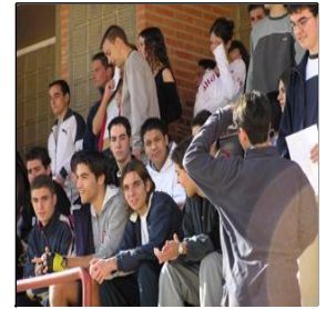
Alumnos del Ben Arabí