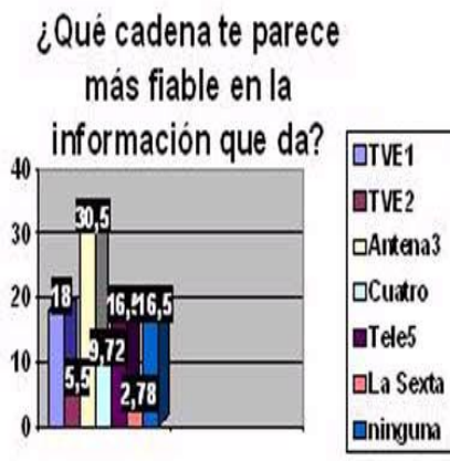
Los alumnos del Ben Arabí frente a las elecciones de mayo de 2007